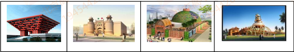
中国馆 巴基斯坦馆 印度馆 尼泊尔馆

29. 2010 年，全世界的目光将聚焦上海世博会。届时，各国和各地区将通过自己独特的建筑风格、科技和工业产品等方式展示城市文明成果。下面是部分亚洲国家的展馆示意图。观察图片，回答问题。