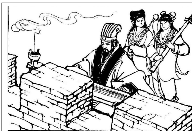
孔明端坐在城楼前面，焚起一炉好香，平心息气，安安静静地弹起琴来。