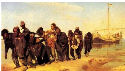
③ 《伏尔加河上的纤夫》