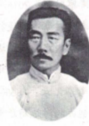
鲁迅：《狂人日记》的作者