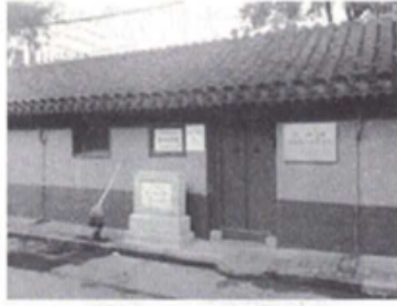
金陵机器制造局旧址