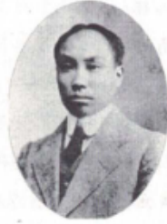
陈独秀：《新青年》创办者