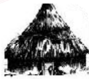
长江中下游地区 的原始房屋图