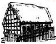
黄河中下游地区 的原始房屋图