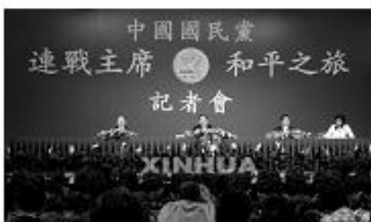
图 9: 和平之旅

( 3 ) 据材料三，指出“一国两制”构想提出的依据。( 2 分)这种政治构想在我国已有什么成功的实践范例?( 1 分)有什么重大的历史意义( 3 分)