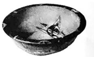
图1 半坡人面鱼纹彩陶盆

2. 我们的先人很早就认识到生态环境的重要性。孔子说:“钓而不纲, 弋不射宿。”意思是“不用大网打鱼, 不射夜宿之鸟”。这一观点出自 ( )